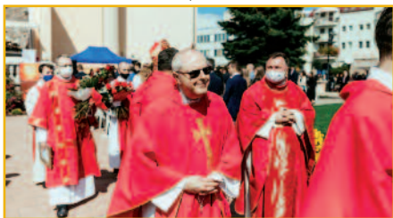
Zástup kňazov po slávnosti udelenia sviatosti birmovania v Topolčanoch