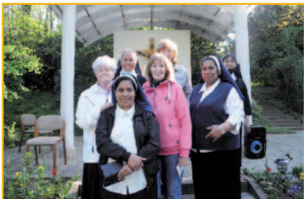
Okolo Dcéry Našej milej Matky NSJ rástlo 2. spolocenstvo.