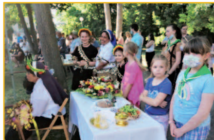
V Lukovom dvore deti v procesii s obetnymi darmi (11. 6. 2021)