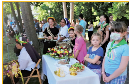
V Lukovom dvore deti v procesii s obetnými darmi (11. 6. 2021)