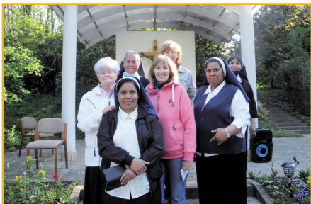
Okolo Dcéry Našej milý Matky NSJ rástlo 2. spoločnosť.