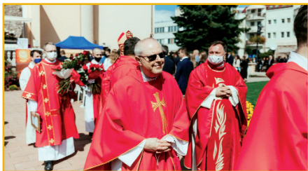
Zástup kňazov po slávnosti udelenia sviatosti birmovania v Topolčanoch